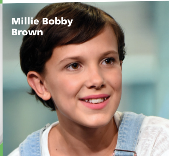
Millie Bobby Brown